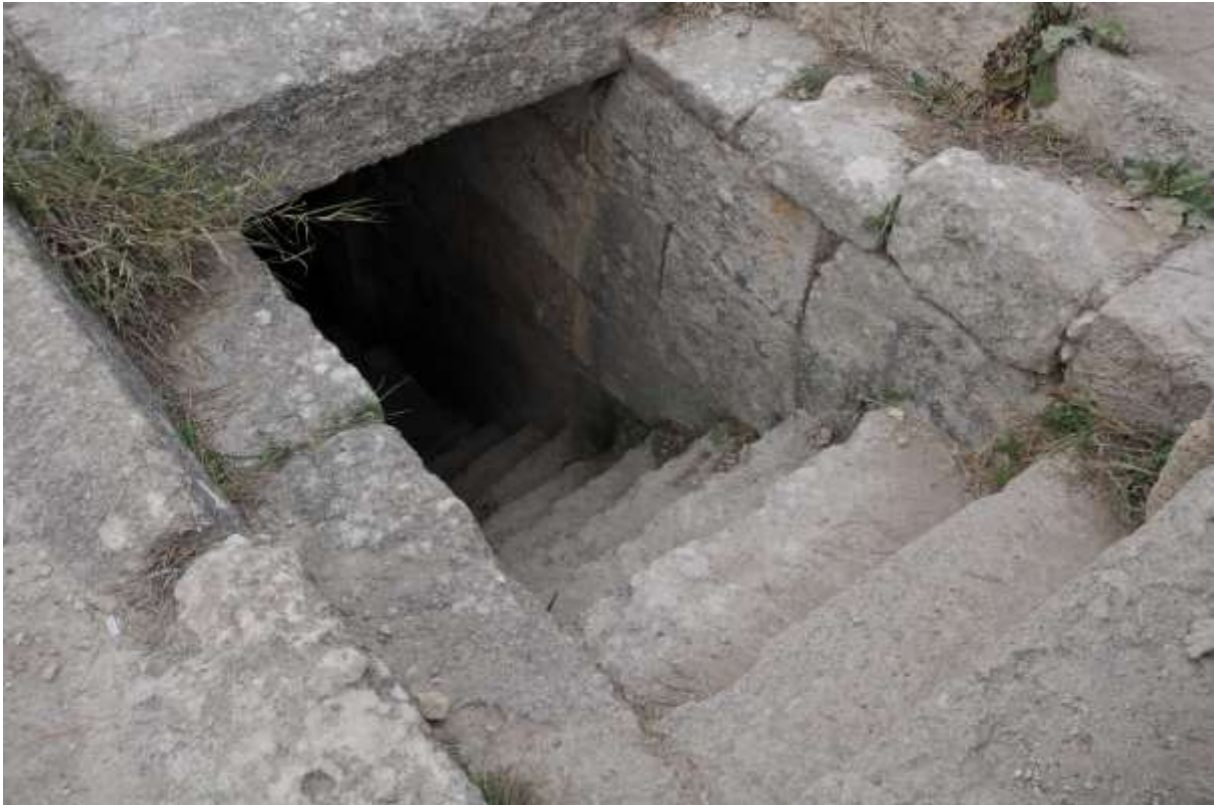
Zugang zu einer Tontafelkammer (J. Favresse)

Die auf Tontafeln eingedrückten Keilzeichen sind in der Übersetzung erstaunlicher Weise mit unseren heutigen Buchstaben vergleichbar. Damit hebt sich dieses Alphabet aus einer Vielzahl von damaligen phönizischen Varianten hervor. Generell muss man meinen, unser Schriftstamm entstammt der Levante, also von den Phöniziern, auch wegen des Fehlens älterer vergleichbarer Schriftquellen ab. Eventuell gelangte es sogar über die Seidenstraße kommend als Begleitung des Handels in die Levante und dann über die Griechen und Römer letztlich zu uns.