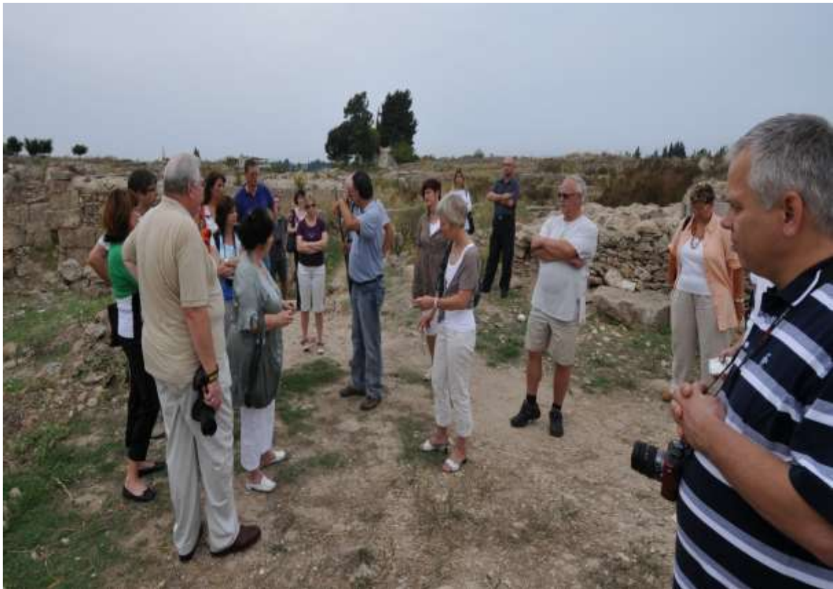
Besichtigung der Ruinen von Ugarit (J. Favresse)

Besonders müssen wir heute uns mit dem Entwicklungsstand der Schrift in Ugarit verbunden fühlen. Die ugaritische Schrift ist unserer Schrift durch die verwendeten Schriftzeichen sehr ähnlich.